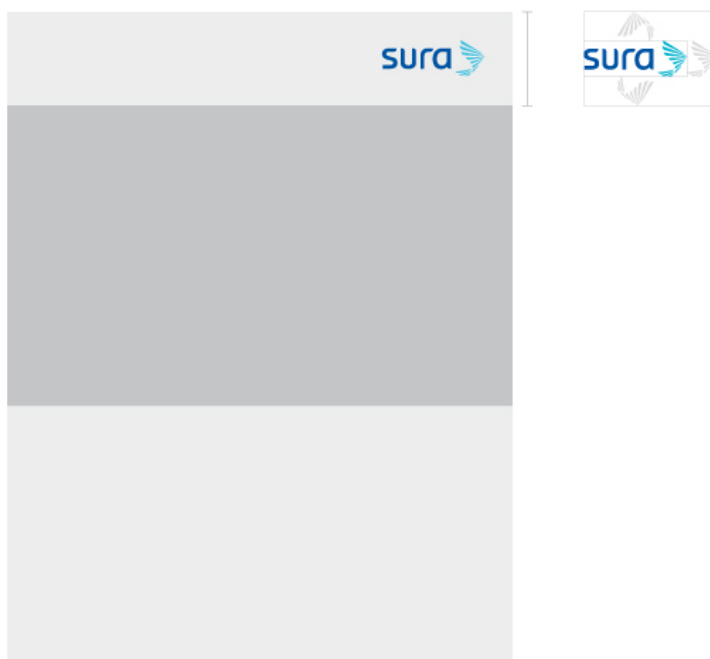
Imagen con tres márgenes

Hay dos posibilidades de usar la imagen con tres márgenes, ya sea que la imagen esté en la parte superior o en la inferior del anuncio.