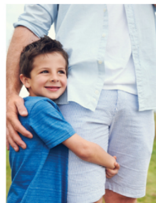
Imagen con dos márgenes

Cuando la imagen lleva los dos márgenes, se debe dejar una distancia mínima entre la imagen y el margen superior. El espacio mínimo se calcula agregando la distancia del isotipo o de las siglas de AFP, a la parte inferior.