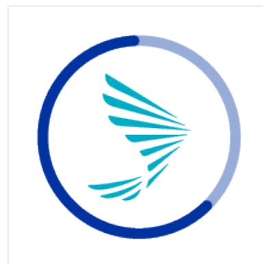
Loading Azul SURA