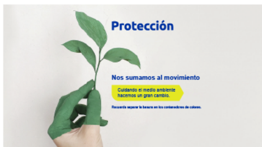
Medio ambiente (16:9)