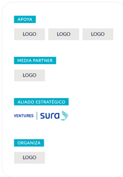
Escarapela para evento como aliado