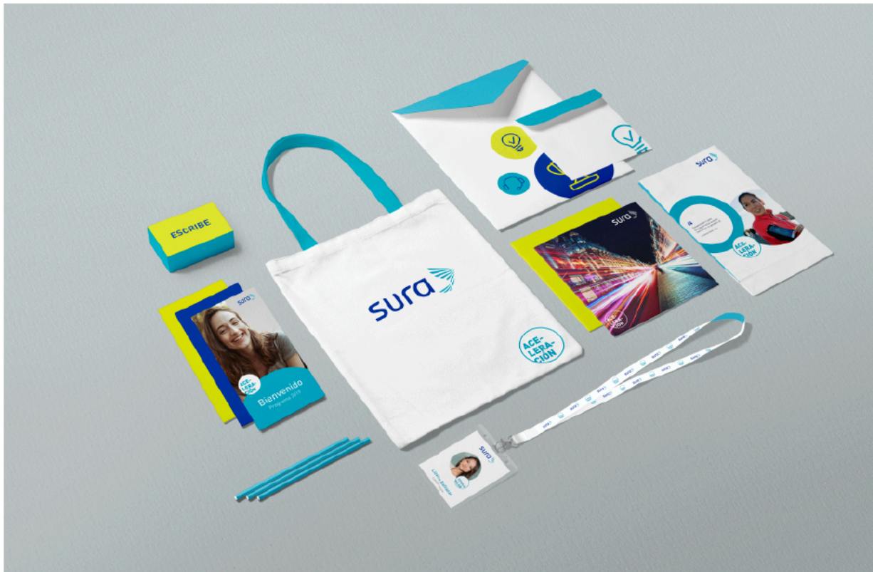
Kit de Bienvenida