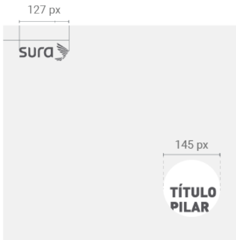
Fotografía sangrada a 4 lados