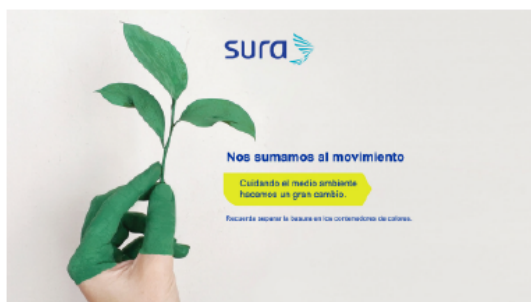
Medio ambiente [16:9]