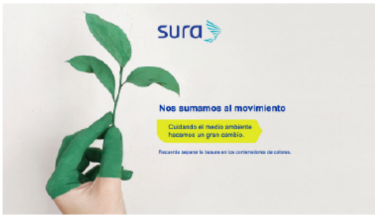
Medio ambiente [16:9]