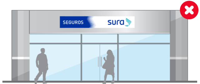
No ocupar la totalidad del espacio disponible horizontalmente. El señalamiento debe adecuarse al entorno físico de la sucursal.