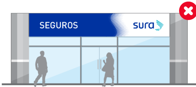
Cambiar las proporciones de los elementos del señalamiento.