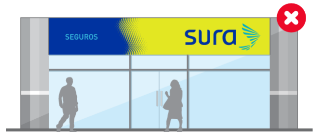
Utilizar colores diferentes a los que se encuentran en este manual.