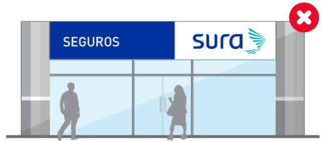
Omitir el degradado vectorial para los señalamientos que lo requieren.